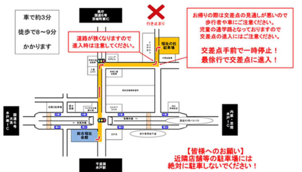
総合福祉会館福祉の杜駐車場案内図（平成31年4月1日から運用開始）